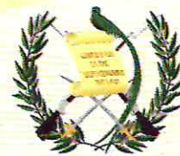
Tabla de contenido

DEPARTAMENTO DE CHIQUIMULA, GUATEMALA, C.A.